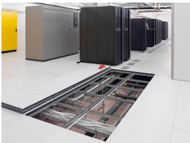
Serverräume, bzw. Räume mit einer hohen Anzahl von anzusteu- ernden elektronischen oder technischen Einheiten werden vorzugs- weise mit einem Doppelboden ausgestattet. Die Öffnung an jedem beliebigen Punkt erlaubt eine einfache Revision