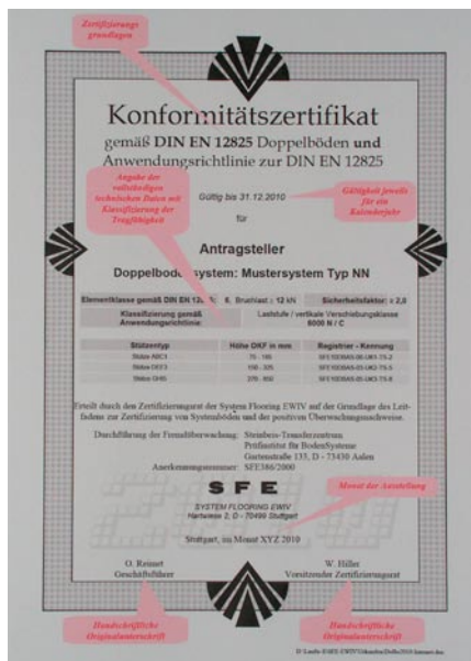
Beispiel eines Konformitätszertifikats

Planung und Ausführung haben. Die DIN EN 13213 Hohlböden und DIN EN 12825 Doppelböden mit den entsprechenden Anwendungsrichtlinien bilden dazu die Grundlage.