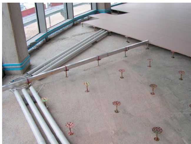
Flächen für eine variable Nutzung in den Bereichen Büro, Verwal- tung, Kommunikation werden meist in Form von Hohlböden ausgeführt. Für die Tragschicht auf der Schalungsfläche wird nach Auflage einer abdichtenden Folie in der Regel ein Anhydrit- Fließestrich verwendet

zungssicherheit inklusive Brand- und Schall- schutz, Oberflächengestaltung, Ableitung statischer Ladungen und die Pflege bzw. Hygiene bilden ein Anforderungsprofil das über eine reine Gebrauchstauglichkeit hin- aus zu erfüllen ist.